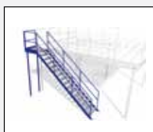
Trappa med avstigningsplan