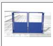
Självstängande grind med slitplåt. Bredd 1500 mm.