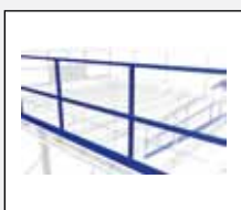
Räcke med sparkplåt